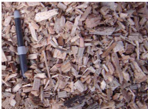
Photo 2 : Plaquettes forestières produites et consommées par la SARL La Charamousse